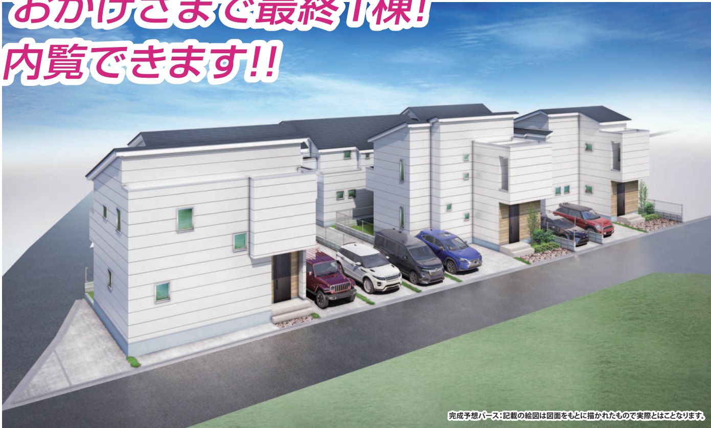
完成予想パース:記載の絵図は図面をもとに描かれたもので実際とはことなります。